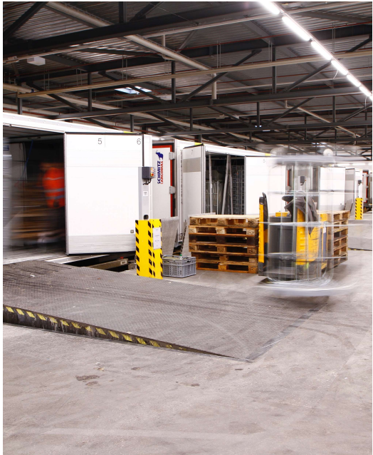
Direktbelad in Bahnhalle oder über LKW-Rampe mittels Horizontalumschlag