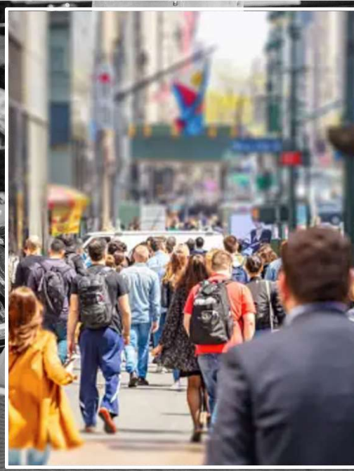
ungebremste Zunahme der Wohnbevölkerung in der Schweiz