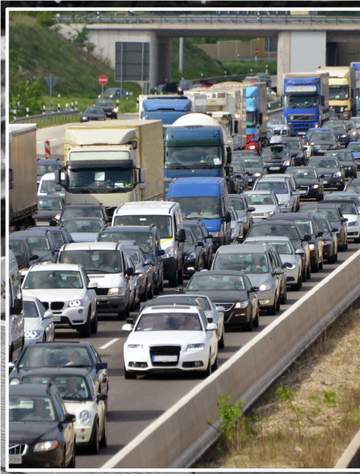
2022 wurden rund 39'900 Stautunden registriert