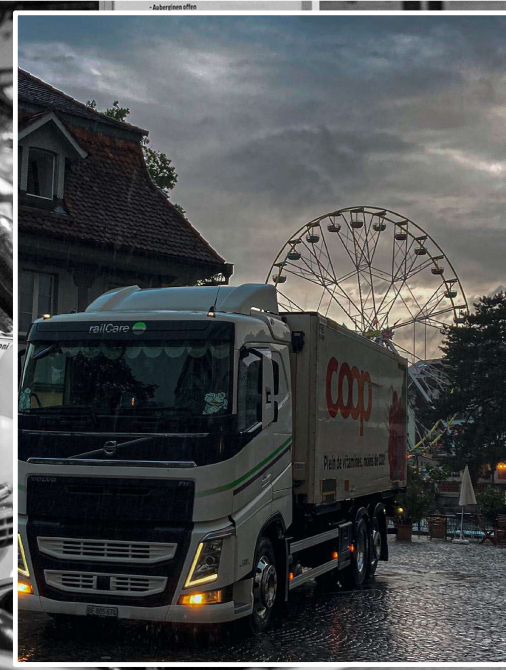
sinkende Akzeptanz der Logistik in Innenstädten