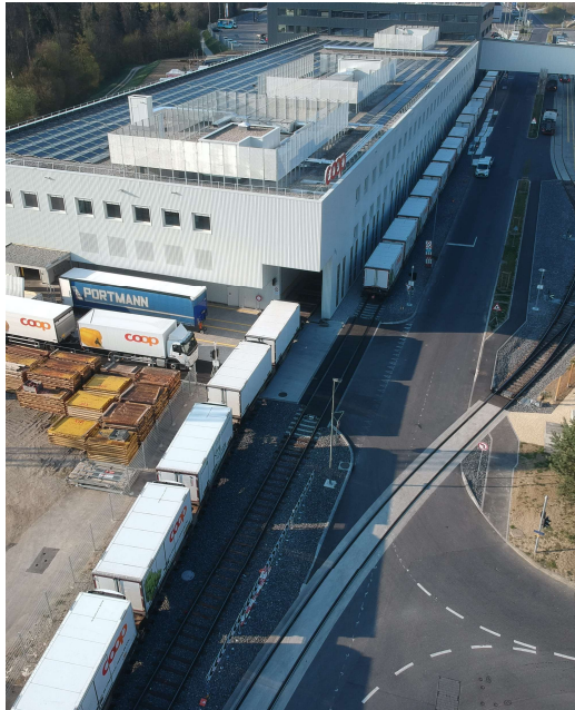
3 Züge täglich Aclens - Genève (90 - 100 Wechselbrücken)