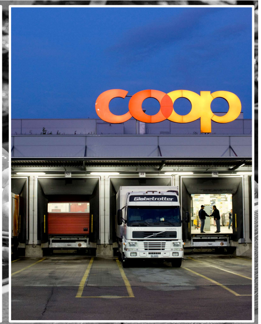
dynamische Lieferzyklen, just-in-time Logistik