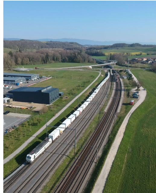
ökologisch, zuverlässig und pünktlich per Bahn